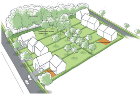
Hypothèse de répartition de logement sur les lots

Le projet de la ZAC participe à l'extension urbaine de Saint Aubin de Cormier. Située en seconde couronne de Rennes, la commune doit répondre à la demande d'accueil de nouveaux habitants.